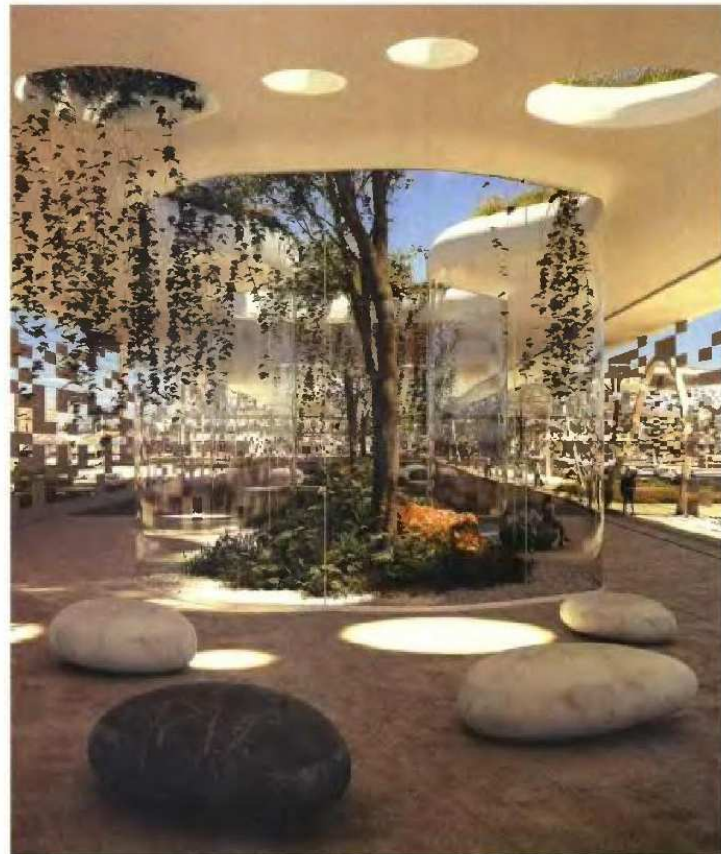
Στον χώρο υποδοχής του υδατοδρομίου προβλέπονται εσωτερικοί κήποι με ενδημικά φυτά και δέντρα της αττικής γης, όπως ελιά, θυμάρι και λεβάντα.